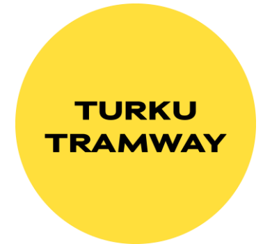
Turun raitiotien logo.